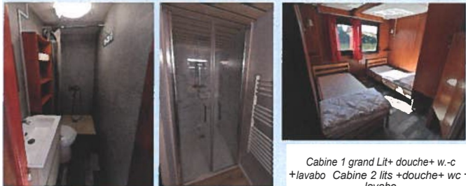
Cabine 1 grand Lit+ douche+ w.-c +lavabo Cabine 2 lits +douche+ wc + lavabo Coin cuisine